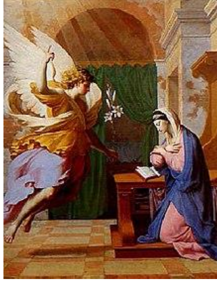
Resim 12: Bakire Meryem

Açıklama: Cebrail, Meryem'e İsa'nın hamileliğini bildiriyor. "Annunciation" Eustache Le Sueur, (17th Century).