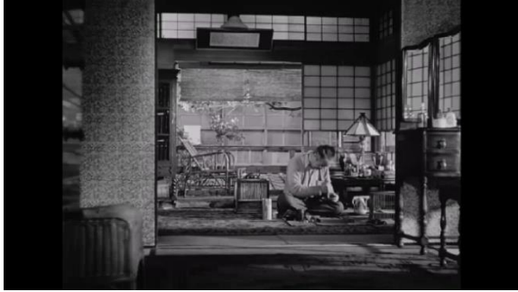
Şekil 3. Erken Gelen Yaz 'da baba Shukichi evde çalışırken