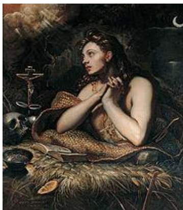
"The Penitent Magdalene" (1598), Domenico Tintoretto