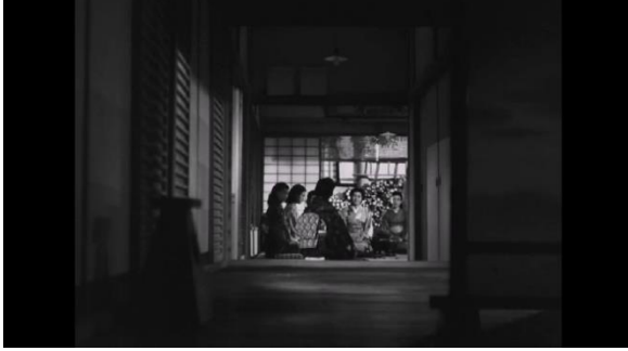
Şekil 1. Geç Gelen Bahar 'ın ilk sekansındaki düğün merasimi