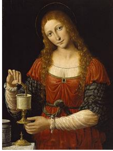
Kaynak: Ressam, Andrea Solari, (1524).

Adamın arkasında bekler, ağlar, gözyaşları adamın ayaklarına düşer ve saçları ile gözyaşlarını siler. Sonra adamın ayaklarını öper ve güzel kokulu merhemi ile temizler. Simon bunu görünce, "Eğer bu adam peygamber ise ona dokunan kadının kötü biri olduğunu biliyordur" diye düşünür. İsa, kadını suçlamaz ve onun jestini geri çevirmez. Bütün günahlar affedilmeli diye düşünür ve "Günahların bağışlandı, iman seni kurtardı, esenlik içinde git" der. Kadının elinde mür kâsesi tutması ve saçlarını gevşetmesi aslında bir yatak odası samimiyetidir. Luka İncili daha fazla erotizme girmeme konusunda dikkatli iken, Matta ve Mark İncili ise para konusuna girmek istemezler. İsa'nın sözleri ise kadının düştüğü kötü hali teselli etmek üzerinedir.