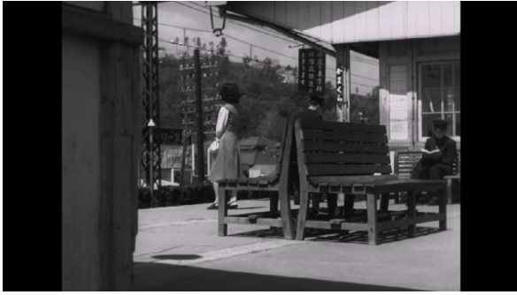
Şekil 7. ve Şekil 8. Geç Gelen Bahar 'da Noriko ve komşusu tren beklerken 360° alan kullanımı